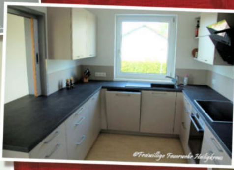
Küche mit einer Durchreiche in den Gemeinschaftsraum