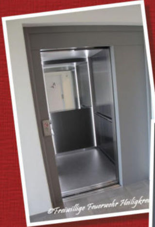
Aufzug und Fluchttreppe