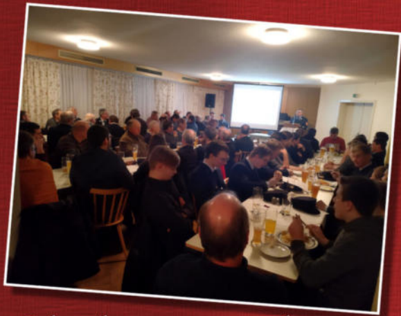
Jahreshauptversammlung beim Gasthof Beilmeier in Lindach

Mitglieder im Verein aktuell: 197 Mitbürgerinnen und Mitbürger