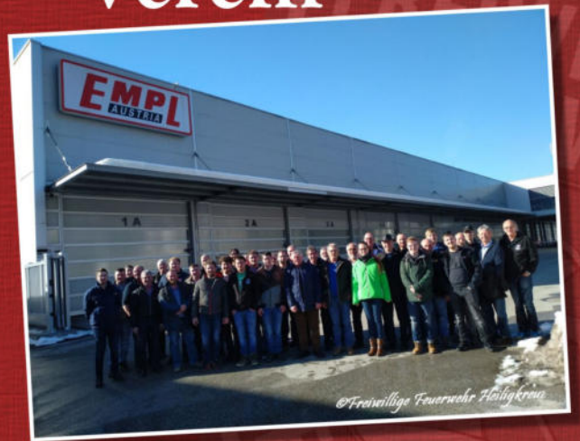
Feuerwehrausflug 2019 zum Feuerwehrfahrzeugbauer