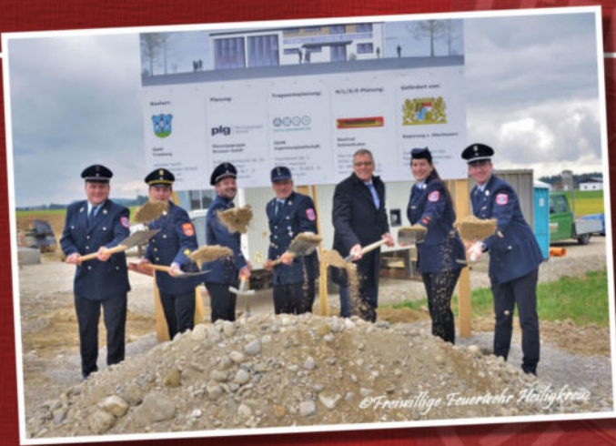
Spatenstich 26.März 2019

Grundfläche Gerätehaus 336m 2 Geschossfläche 671,93m 2